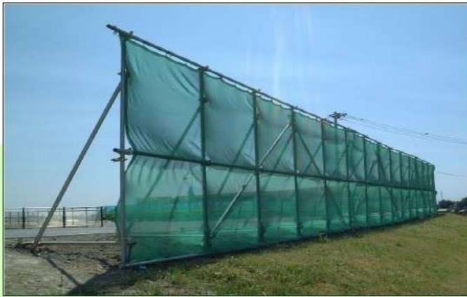
(仮設のフェンスに!)