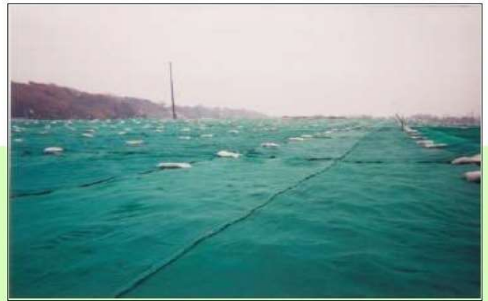
(盛土の飛砂防止に!)